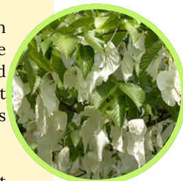
Arbre aux mouchoirs

Le repas du midi a rassemblé Français et Allemands dans un sympathique restaurant de la petite ville d'Idstein qui a révélé ses trésors lors des visites commentées de l'après-midi : château, tour des sorcières, maisons à colombages superbement colorées, église protestante curieusement très décorée. L'histoire racontée, au détour des ruelles, a passionné les participants, malgré un vent glacial.